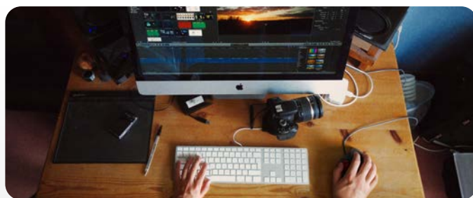
FOTO E VIDEO REPORT

Forniamo un servizio di realizzazione e distribuzione per supporti di piccolo formato stampa (pieghevoli, flyer, ecc.) che saranno distribuiti a bordo dei nostri poliambulatori mobili.