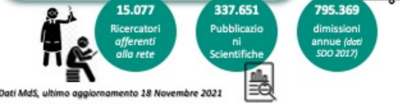
Dati Mds, ultimo aggiornamento 18 Novembre 2021

Revisione e aggiornamento dell'attuale quadro giuridico degli IRCCS (da emanare entro il quarto trimestre del 2022) Aggiornare le politiche di ricerca del Ministero Rafforzare il rapporto tra ricerca, innovazione e cure Obiettivi operativi: ➢ Differenziare IRCCS per attività mono- e plurispecialistica, ➢ Creare rete integrata, ➢ Favorire reti formative con strutture del SSN e atenei, ➢ Rafforzare il ruolo di IRCCS quali hub trasferimento delle conoscenze, ➢ Incentivare la capacità degli Istituti di attrarre risorse e partecipare in ambiti di ricerca nazionale e internazionale.