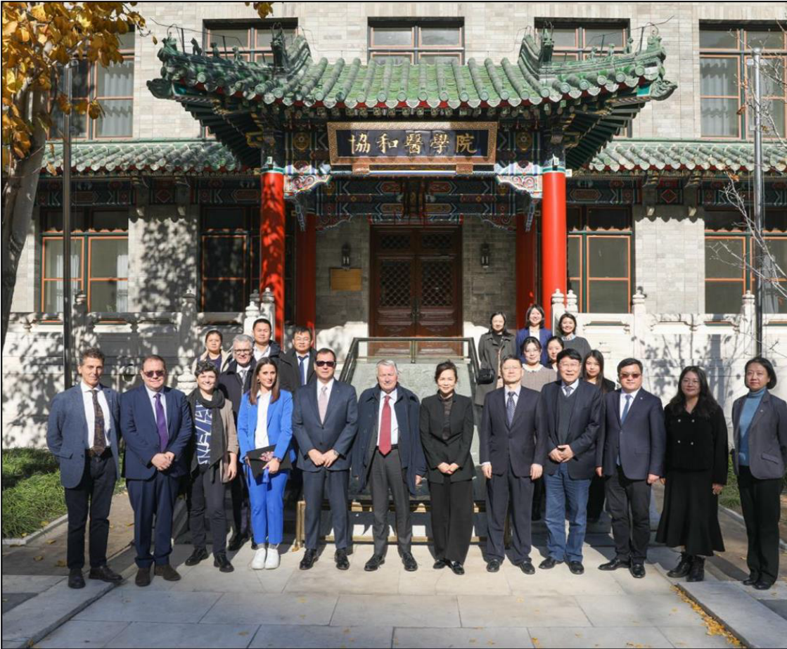
ISS all'Accademia delle Scienze Mediche, 14 novembre 2025, Pechino

Due MoU sono stati firmati con enti sanitari cinesi per avviare collaborazioni scientifiche concrete.