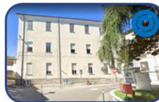
Attività assistenziale e Radioterapia: Palazzina Radioterapia Padova (PD)