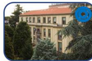
Ospedale Busonera - Padova: Attività Assistenziale e Ricerca (120 P.L.)