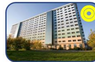
Ospedale San Giacomo Castelfranco Veneto (TV): Attività Assistenziale e Ricerca (88 P.L.)