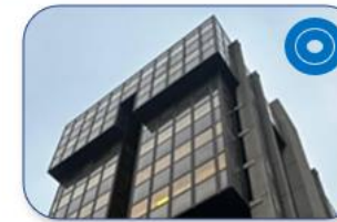
Attività Amministrativa e Direzione Scientifica – P.zza Salvemini (PD)