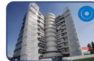
Laboratori presso la Torre della Ricerca (PD)