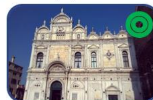
Biobanca presso Ospedale SS. Giovanni e Paolo (VE)