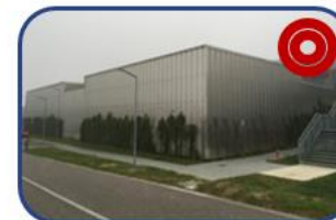
Attività assistenziale e Radioterapia: Ospedali Riuniti Padova Sud Schiavonia (PD)